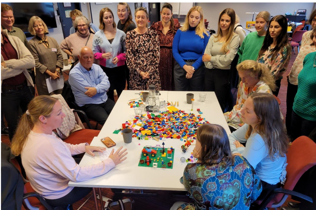
I september 2024 afholdt retten temadag om handlingsplan for 2025-2027. Der blev blandt andet bygget med Lego.

I 2024 fortsatte Mærsk sit store nedrivnings- og ombygningsprojekt lige over for rettens lokaler i Amaliegade. Det medførte også i 2024 en del gener for rettens brugere og personale. Retten har dog haft en god dialog med bygherren, og vi kan positivt konstatere, at de værst støjende arbejder synes at ligge bag os. Der er dog stadig baggrundsstøj, og vi ser frem til, at byggeriet efter planen afsluttes med udgangen af 2026.