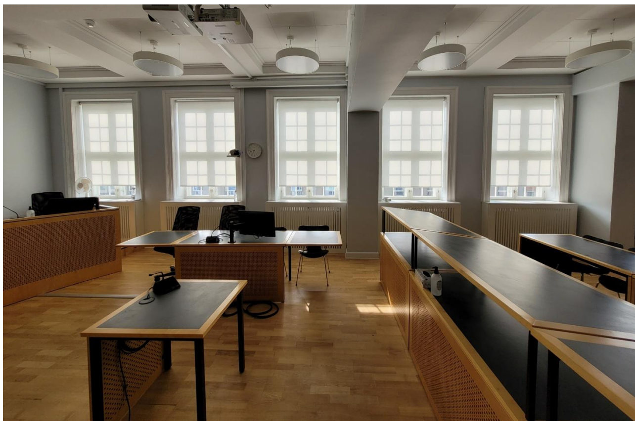
Retssal B set fra sagsøgtes side af salen