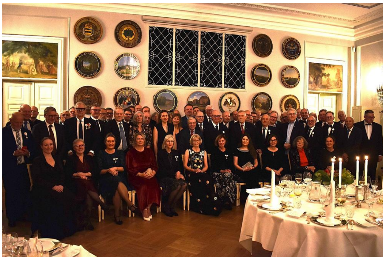
I november 2024 fejrede Foreningen af Sø- og Handelsrettens sagkyndige dommere 100-års jubilæum.

Ud over sagsbehandlingen bruger vi i løbet af året også tid på at styrke samarbejdet og dele viden både internt og eksternt. I 2024 afholdt vi f.eks. et seminar for sagkyndige dommere med to medlemmer fra Folketingets Retsudvalg, hvor vi drøftede domstolenes og særligt Sø- og Handelsrettens rolle og udvikling. Vi har i løbet af året også faste dialogmøder mv. med repræsentanter for vores professionelle brugere inden for både det insolvensretlige og det civilretlige område. Sø- og Handelsretten har mange internationale sager, og derfor holder vi os også opdateret ved at deltage i møder med navnlig udenlandske dommerkollegaer og repræsentanter for Kommissionen, EUIPO og EPO i løbet af året. En særlig begivenhed i 2024 var 100-års jubilæet for Foreningen af Sø- og Handelsrettens sagkyndige dommere.