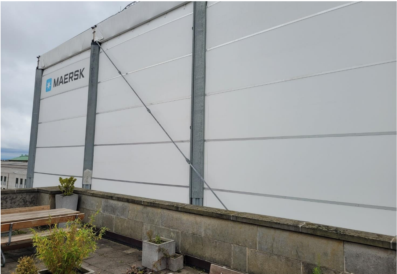
Mærsk-byggeriet i Amaliegade 45 set fra rettens terrasse.