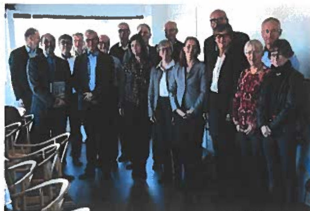
Højesteret i møde med Grønlands justitsminister

Endvidere besøgte Højesteret Landstingets Ombudsmand, Landstingets formand, Rigsombudsmanden, Landsstyret, politimesteren, Arktisk Kommando, Departementet for Natur, Miljø og Justitsområdet samt Royal Greenland.