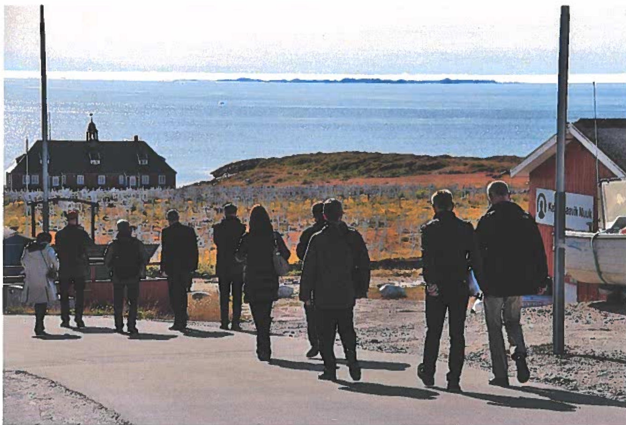
Højesteret på vej til møde med Rigsombudsmanden

I forbindelse med besøget var Højesteret vært ved et foredrag om Højesteret for jurister hos Rigsombudsmanden, politiet, Landstingets Ombudsmand, advokater og justitsområdet. Omkring 70 personer mødte op til foredraget.